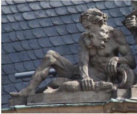
Flussgott Neckar mit Krug und Fisch, Dachfigur des Neuen Schlosses in Stuttgart