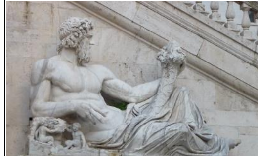
Flussgott Tiber, Rom