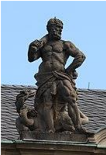
Herkules als Virtus Heroica (Heldenmut) mit Knüttel, Hydra, Fell des Nemeischen Löwen, Dachfigur des Neuen Schlosses in Stuttgart