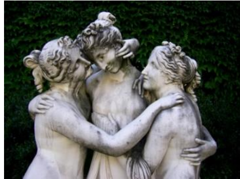
Die drei Grazien, Staatsgalerie Stuttgart